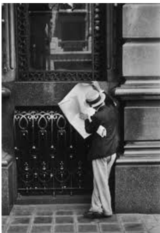
Buenos Aires – Horacio Coppola

Seas local o no, te invitamos a que hagas el recorrido para apreciar de qué manera se presenta esta ciudad de la que hoy somos todos protagonistas. A partir del mismo, y de éstas simples líneas, elabora una definición propia de Buenos Aires; "Ciudad _____".