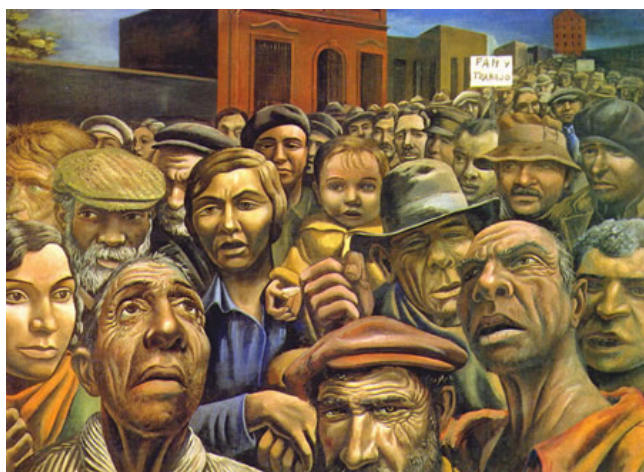
Manifestación – Antonio Berni