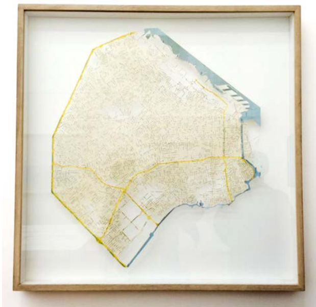
Mapa de Buenos Aires – Jorge Macchi

América Invertida - Joaquín Torres García