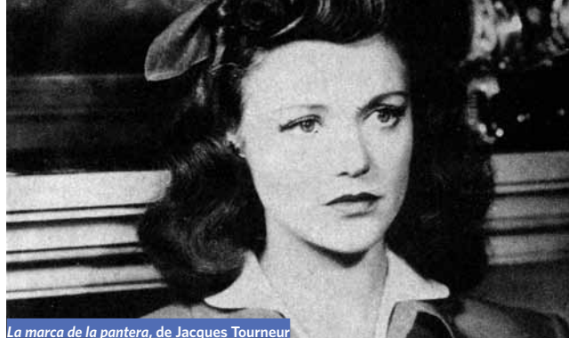
La marca de la pantera, de Jacques Tourneur

Es indudable que hay films que nacen con buena estrella. Se trata de una estrella particular, solo a ellos designada. Ya que estamos, puede hablarse también de una conjunción astral. Un momento, una situación dada, un aire de familia que, como polen histórico, sutilmente se esparce por el aire