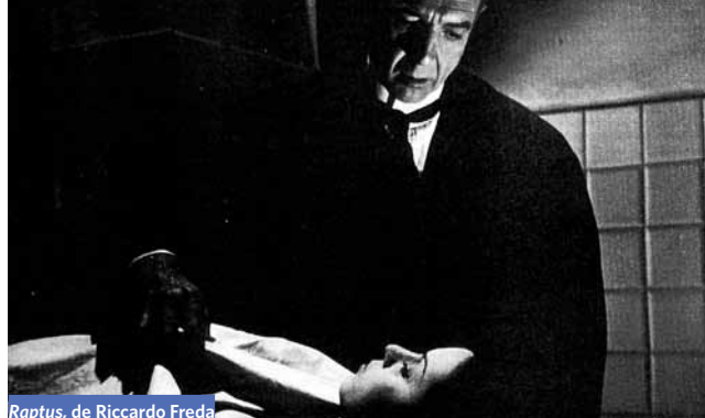
Raptus, de Riccardo Freda

( Cat People , EUA-1942) de Jacques Tourneur, c/Simone Simon, Kent Smith, Tom Conway, Jack Holt, Jane Randolph. 73'.