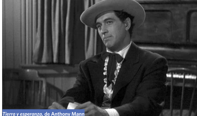
Tierra y esperanza, de Anthony Mann

A Christensen se lo ha intentado petrificar en los marbetes de formalistas -como si todo director buscara una forma- y caligrafista, en el peor estilo de la peor crítica italiana. De la segunda generación de clásicos argentinos,