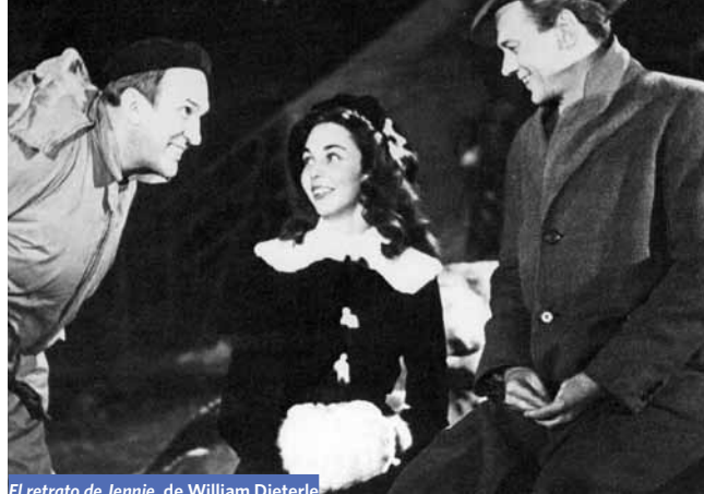
El retrato de Jennie, de William Dieterle

Pero para ese “tras” debe existir un hecho operativo. Una materia base, una causa material que sostenga esa operación de metamorfosis. El cultivo, la alimentación, la propia historia como despliegue son algunos de sus soportes o puntos de partida. El arte es uno de los más sutiles y peliagudos porque no lo hemos tomado de la naturaleza como fruto en sazón, sino que se lo hemos sumado a ella. A veces esta suma es armónica y muchas otras veces, en cambio, es polémica y dramática. ¿Se fundirá en aquella o será rechazada como órgano artificial fallidamente transplantado?