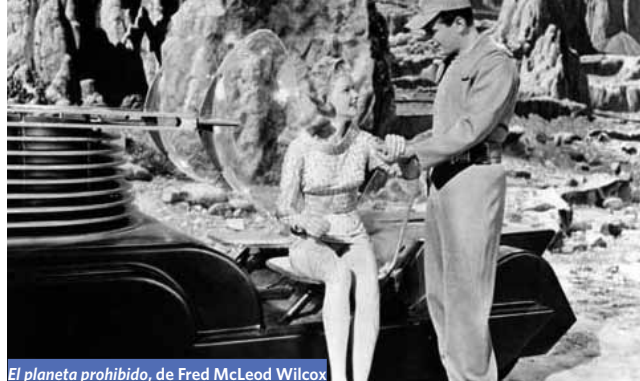
El planeta prohibido, de Fred McLeod Wilcox

( Deer Hunter , EUA-1978) de Michael Cimino, c/Robert De Niro, John Cazale, John Savage, Christopher Walken, Meryl Streep. 182'.