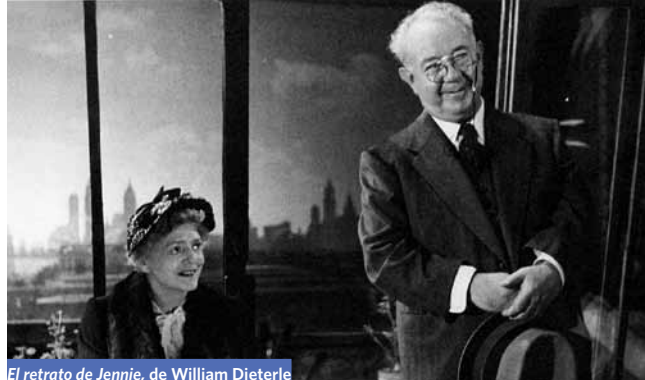
El retrato de Jennie, de William Dieterle

Film único, con el que uno se lamenta que Charles Laughton nos escatimara otros esfuerzos como director ahorrándonos de paso unos cuantos como actor, dado como era a ese exceso inútil que los franceses llaman cabotinage y nosotros llamamos camelo. Este film es una fábula iniciática que deriva con notable facilidad -la facilidad es todo aquello bien hecho luego de que lo entendemos- hacia lo onírico. Se trata de una fantasía muy particular que recuerda los grabados de Arthur Rackman y los relatos de Beatrix Potter, lo que podría calificarse aquí de nursery thriller con algo de gótico sureño.