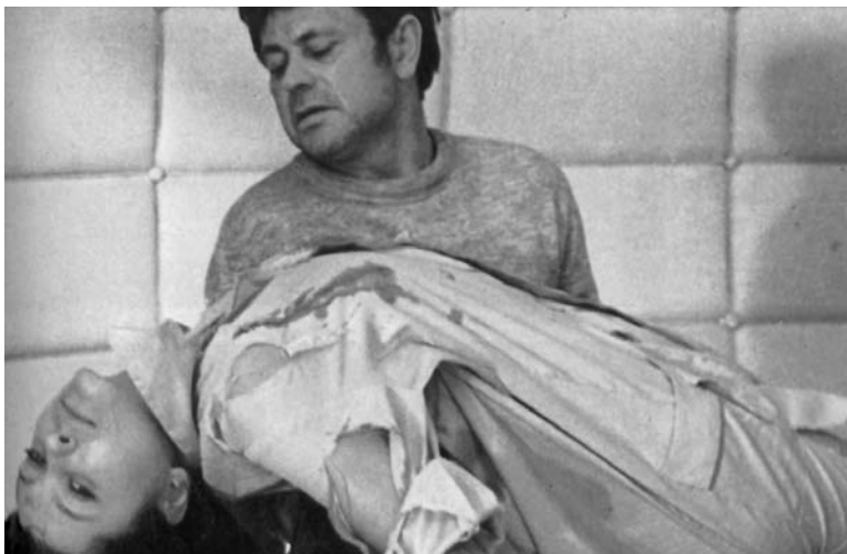
Solaris, de Andrei Tarkovski

presunto héroe muere antes de los diez minutos), el director desarrolla una orgía de terror y violencia en la que las expectativas del espectador se ven constantemente desmontadas por los bruscos cambios de tono de la narración. Film obsesivo y claustrofóbico, en el que los personajes apelan a todo tipo de recurso para sobrevivir, desemboca en un final marcadamente nihilista que también destruye cualquier atisbo de resolución edificante. Imitada hasta cansancio incluso por el propio director, es una de las obras maestras indiscutidas del género. Texto de Jorge García.