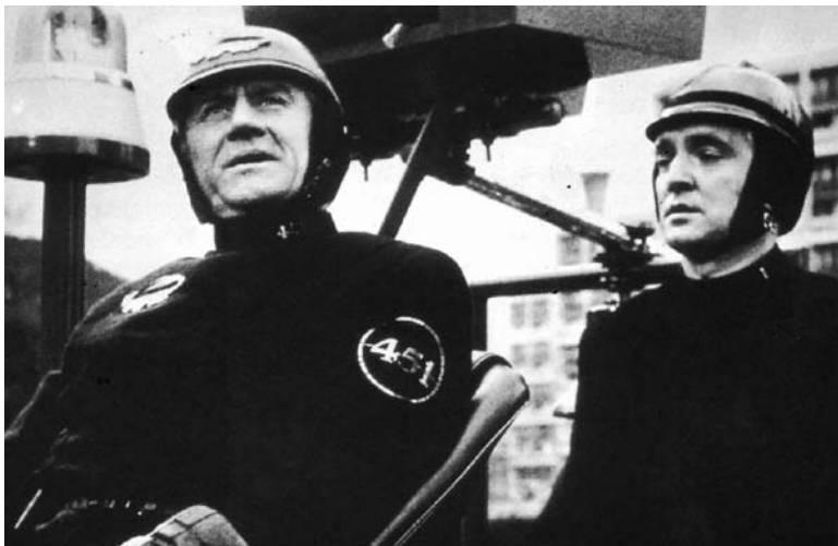
Fahrenheit 451, de François Truffaut

semejante a los excesos “sociales” del nazismo (a partir de caras y costumbres totalmente británicas), que la institución prohibió su exhibición en TV por “demasiado realista”. No hay sin embargo excesos sangrientos: el blanco y negro es opaco, y los habitantes normales del lugar acentúan su conducta de ovejas, porque ya han visto que si se rebelan, son sumariamente ejecutados. Curiosamente, el film ganó un Oscar de la Academia de Hollywood al mejor largometraje documental, cuando en realidad no es un documental ni es un largometraje.