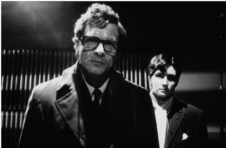
La antena, de Esteban Sapir