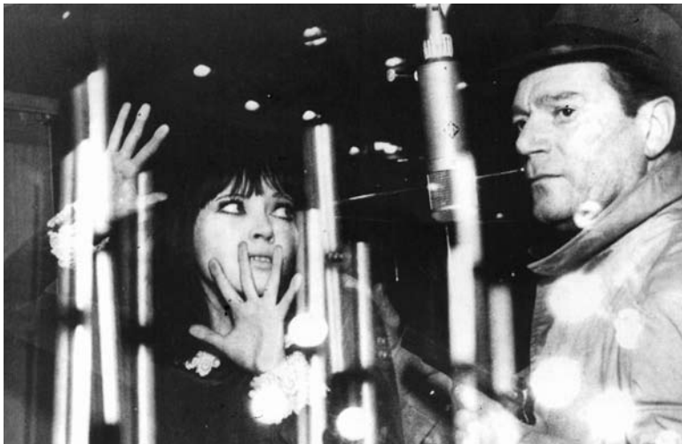
Alphaville, de Jean-Luc Godard

comedia disparatada y mal conocida se atreve a llevar su planteo inicial hasta sus consecuencias más extremas. Llama la atención que no se hable más y mejor de ella en los textos sobre cine latinoamericano.