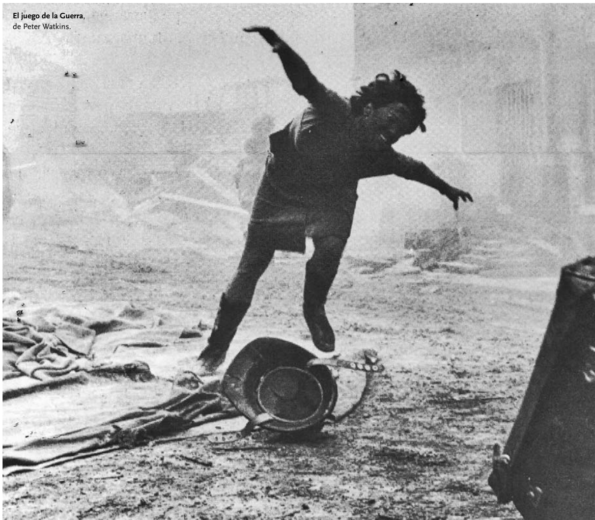
El juego de la Guerra, de Peter Watkins.